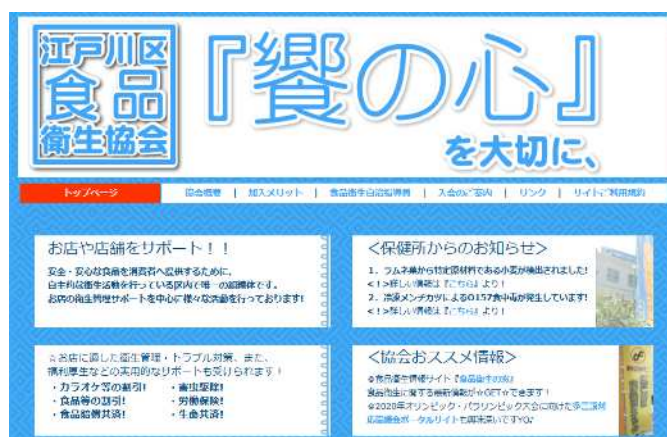
江戸川区食品衛生ホームページのトップページ

協会からのお知らせ以外にも江戸川保健所や東京都、厚生労働省からの最新情報が一目でわかり、大変便利です。ぜひご活用ください。