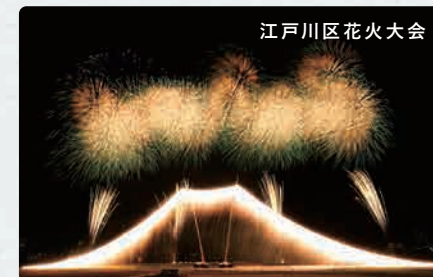
江戸川区花火大会