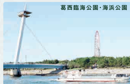
葛西臨海公園・海浜公園