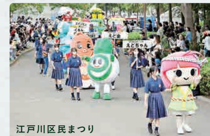
江戸川区民まつり