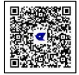
申請書ダウンロード 各種記入例 (区ホームページ)

必要書類をすべてそろえ、各入園希望月の申込締切日までに提出してください(郵送の場合は郵送締切日必着です)。締切日までに提出がない場合は、認定・利用調整の対象になりません。また、状況により、再提出や追加書類が必要になる場合がありますので、期間に余裕をもって提出してください。なお、保育施設では書類等の詳細確認は行いません。