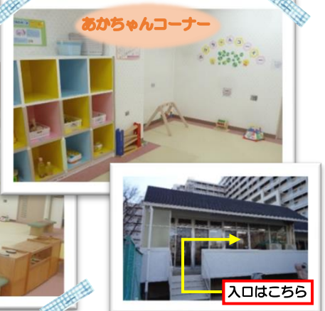
あかちゃんコーナー