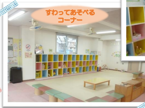
すわってあそべる コーナー