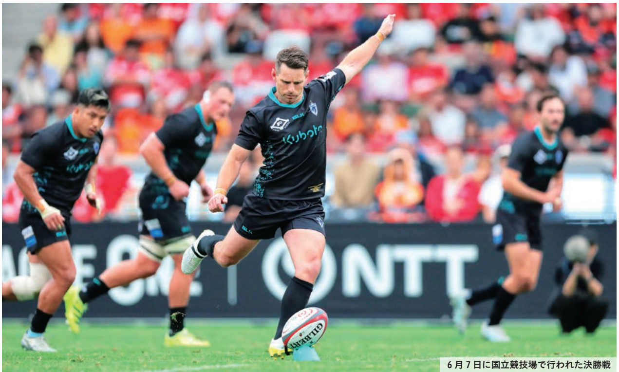
6月7日に国立競技場で行われた決勝戦

区内に拠点を置くクボタスピアーズ船橋・東京ベイは、「NTTジャパンラグビーリーグワン2025-26」のプレーオフトーナメント決勝で、レギュラーシーズン1位のコベルコ神戸スティーラーズと対戦。13-22で惜しくも敗れてしまいましたが、2年連続で準優勝を飾りました。クボタスピアーズの皆さん、夢と感動をありがとうございました！