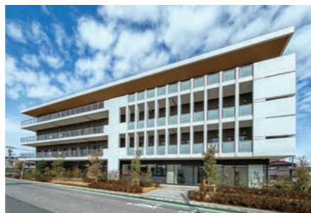
▲特別養護老人ホームいずみ