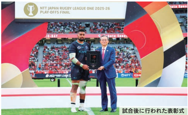
▲戦い抜いた選手たちへ、大きな拍手が送られました