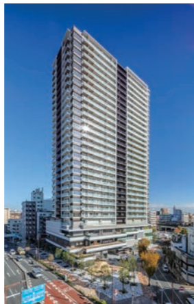
プラウドタワー平井▶