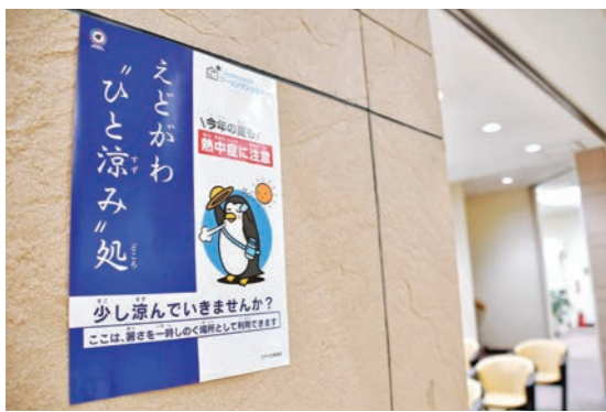
えどがわ「ひと涼み」処として利用できる施設に掲示してあるポスター

今年度の当初予算では、全世代に向けた取り組みを「子育てするなら江戸川区」「仕事も暮らしも江戸川区」「歳を重ねても江戸川区」という三つのキャッチフレーズで整理しましたが、それらをさらに充実したものとするため、新たに着手する取り組みについてご説明いたします。