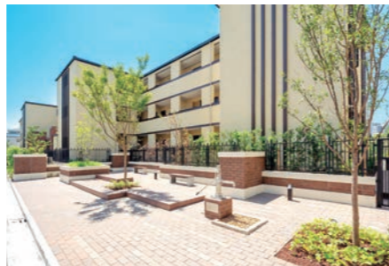
▲K・G FLAT Residence