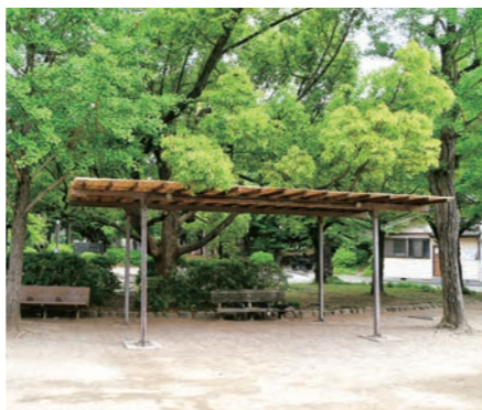
緑陰図書館の会場の一つとなる中央森林公園の木陰

多くの方にお越しいただくことで世代間交流を促すとともに、子どもたちにとっては夏休み中の生活リズムを保つことや、読書習慣の継続にも役立ちます。さらに、冷房を使わない時間が増えることで、二酸化炭素の排出を減らす一助にも