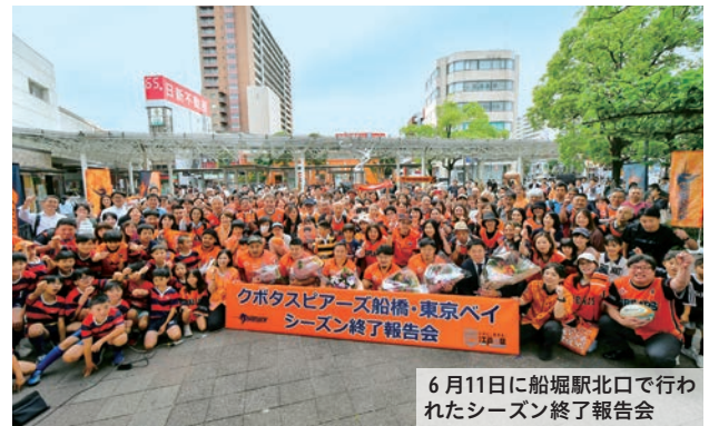
▲ファンに囲まれるクボタスピアーズの選手たち