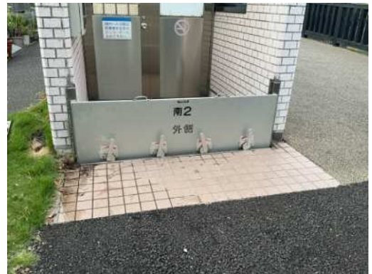
【地下施設への入口】