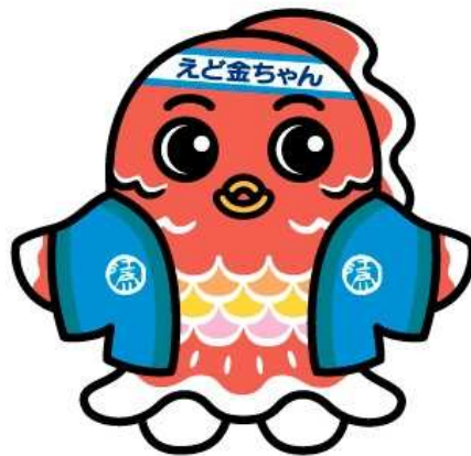
江戸川区特産金魚の応援キャラクター えど金ちゃん