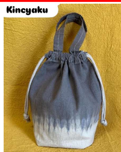
栗ころ巾着 ※絞り染め