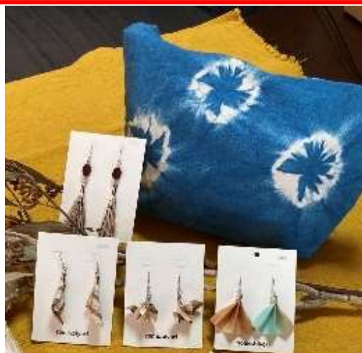
ミニトートバッグ・イヤリング ※絞り染めとまだら染め