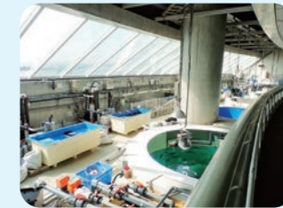
（公財）東京動物園協会