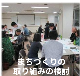
まちづくりの 取り組みの検討