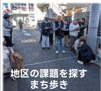
地区の課題を探す まち歩き