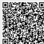
第1号 まちづくりニュース