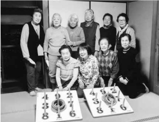
明るく楽しくを大切に活動

日々、役員一同楽しい雰囲気をつくるよう心掛け、明るいクラブ運営をしています。これからも会員同士の親睦を深め、楽しく活動していきたいと思っています。