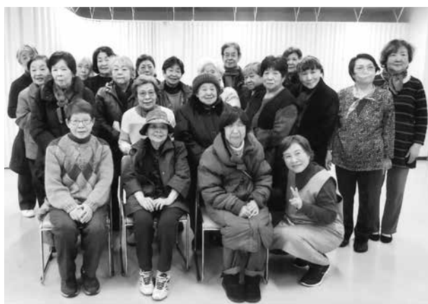
積極的に活動に参加しています