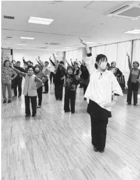
リズム教室ではアクティブに