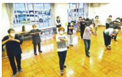
リズム運動で健康づくり

がります。ボランティア活動も積極的に行っており、月に1〜2回小島町2丁目団地1号棟周辺を掃除しています。毎回5人参加し普段の活動場所一帯を綺麗に保ち、清々しい気持ちになります。