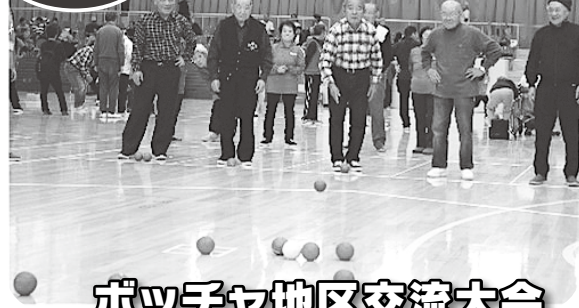
ボッチャ地区交流大会