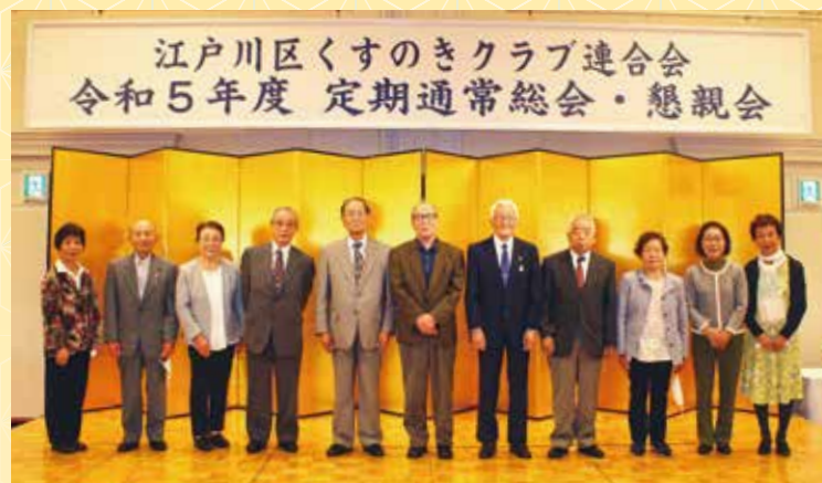
江戸川区くすのきクラブ連合会 令和5年度 定期通常総会・懇親会

5月12日(金)、くすのきクラブ連合会定期通常総会がタワーホール船堀の太陽の間にて行われました。総会では令和4年度事業報告、決算・監査報告、そして令和5年度事業計画・予算案などが審議され、承認されました。