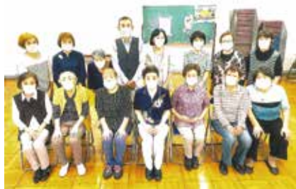
みんなで過ごす時間が宝物

少なく和気あいあいと楽しく行っています。他にも月に2回行う輪投げはとても楽しく、大会を開くと大変盛り上