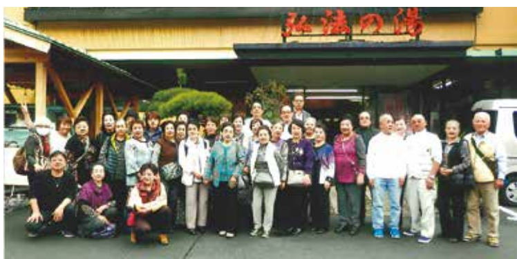
宿泊研修で伊豆長岡温泉「弘法の湯」へ