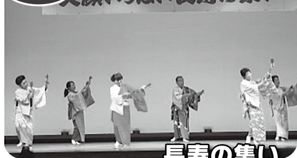
笑顔いっぱい長寿の集い