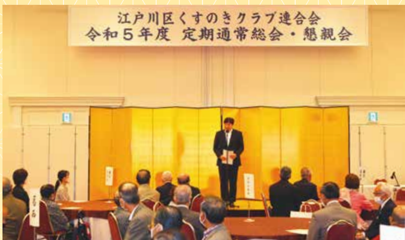
江戸川区くすのきクラブ連合会 令和5年度 定期通常総会・懇親会