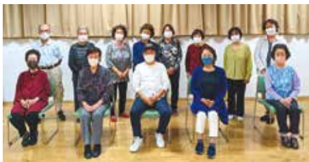
「えどちゃん音頭」を踊った後にみんなで

います。役員全 員で年に数回、 江戸川1丁目・ 町会会館・コ ミュニティ会館 の他にも瑞江駅 周辺の掃除等も 行い、皆様に大 変喜んでいただ いています。