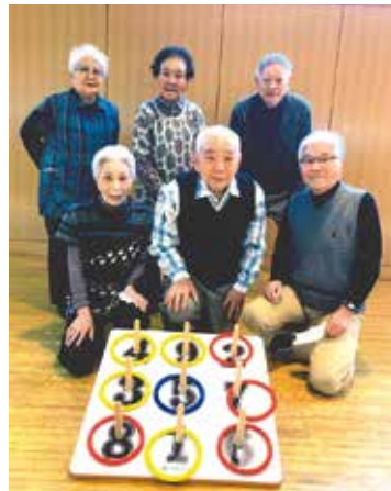
輪投げがつなく会員の輪

私たち笑和会は85名の会員 数を擁し、主に小松川区民館 で活動しながら会員同士親睦