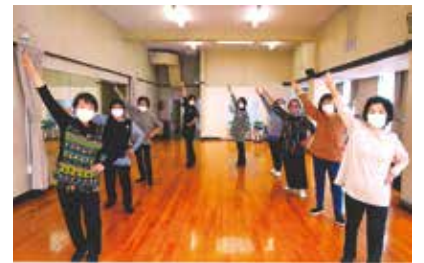
体を動かすと自然と笑顔に

資源回収等それぞれ行っ ていますが、出席・参加 される方々は年々少人数 となり難しい時代に入り ました。