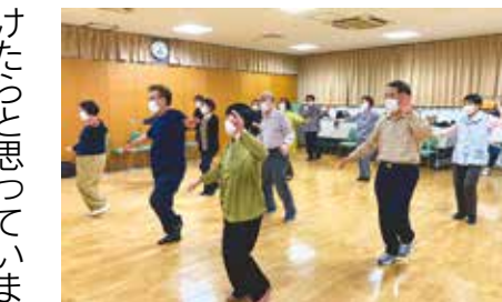
リズムに合わせて「お湯の富士」

役員一同で声をかけ会員の 募集を図っていますが、あま り反応がなく困っています。 さらに人数が多い方が、クラ ブが活性化し、より活発に活 動ができると思いますので大 勢の方が会に入会していただ