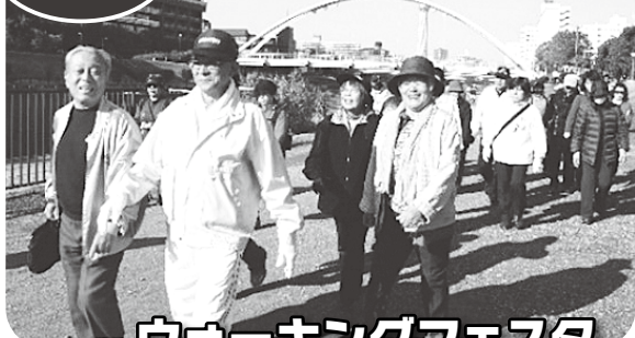
ウォーキングフェスタ