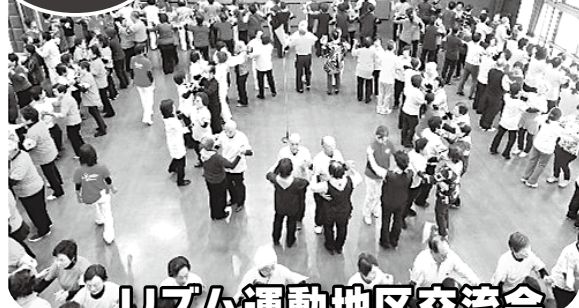
リズム運動地区交流会