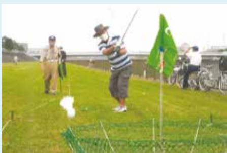
江戸川北部TBGクラブ 毎週日曜会員と勝負