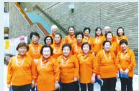
末広会 熟年文化祭で記念写真