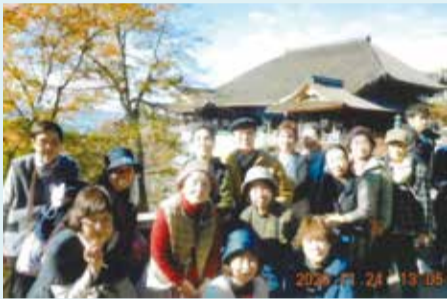
椿クラブ 清水寺の前で記念写真