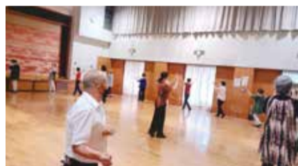
輪になって楽しく踊ります