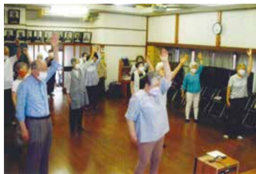
腕を高く伸ばして体をほぐす

て新規会員の獲得は私たちのクラブでも課題であり、10名の役員で毎日声掛けをし案内しています。今後もクラブでより良い方法を見つけていきたいと思えます。