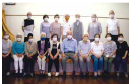
会員増強のため毎日声掛けしています

館清掃を行い近隣町会との交流や行事への参加も積極的に行っています。今後もこのような積極的な町会活動やクラブ活動を続けていきたいと思っております。クラブにおい