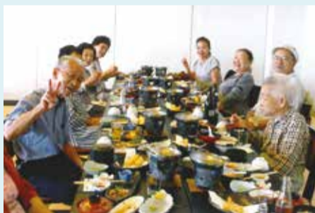
宇喜田第一若草会 城ヶ島京急ホテルで会食