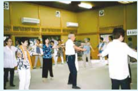
本一色長寿会 みんなでリズム運動