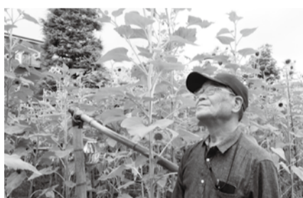
ひまわり迷路の前で笑顔

明大クラブでは「花ボランティア」として、10名ほどの会員が活動しています。 活動場所は「瑞江小学校」で、毎年夏にはひまわりの迷路を作り、子どもたちに喜ばれています。