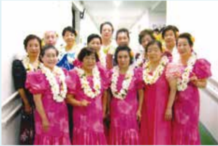
下鎌田長寿会 熟年文化祭デビュー