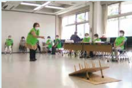
上篠崎喜良久会 クラブで輪投げ大会