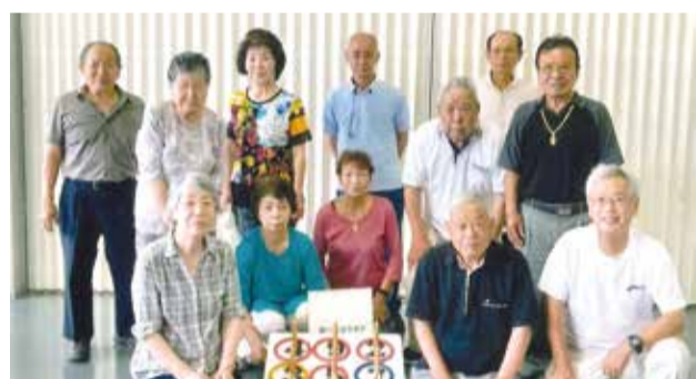
松江コミュニティ会館にて輪投げ練習中