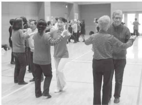
詳細は江戸川区役所 福祉推進課 生きがい係 (5662-0039) までご連絡ください

令和5年1月から3月に、男性限定初心者教室(全10回)を開催します。ベテランの指導員が、優しく丁寧に指導いたします。男性だけの教室なので、気軽に参加していただけます。この教室に参加された方は、令和5年4月から始まる「リズム運動初心者教室」に、優先的に参加することが出来ます。リズム運動に興味のある方、この機会にぜひ体験してみてください。 ※男性限定「初めてのリズム運動教室」の応募については、広報えどがわ11月15日号に掲載予定です