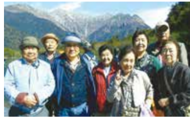
くっきりと見える山の下ハイキング

小島会は江戸川区の南側に位置しています。高齢者の一人暮らしの急激な増加により、小島会は以前より担当範囲が広まりブロックを9班に分け、班長を置き、109名の会員を連絡網で管理、連絡を取り合っています。個人との交流が少なくなりました。