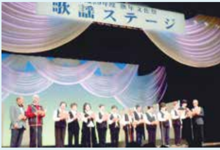
大杉第五菊の会 熟年文化祭で発表

3月に発行されたくすのきクラブ連合会 60周年記念誌を編集するに当たり、皆様から数多くの写真をご提供いただきました。掲載しきれなかった写真を一部ご紹介します！ ご協力ありがとうございました。