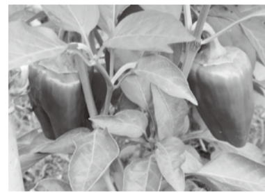
大きなピーマンがいくつもできました

これから秋に向けて、大根とカブを植えようと思っています。昨年は大きくて甘いカブができました。