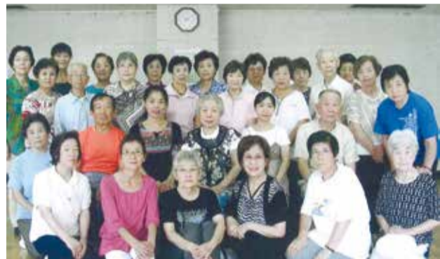
コロナ禍対策万全のカラオケで和気あいあい

新型コロナウイルス感染症対策の中では特にカラオケに力を入れています。最近では感染対策が定着し自然と歌い終わった時にウェットティッシュでマイクの消毒をして、次の人に渡しています。また歌う時もマスクを着け予防しています。他にもリズム運動は、