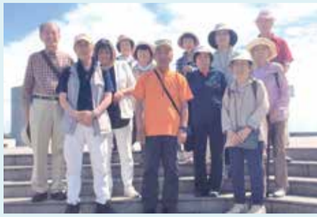
C3西葛西 葛西臨海水族園ウォーキング