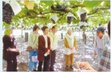
コンドミニアム葛西クラブ 甲府・勝沼で巨峰狩り