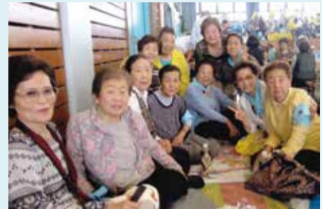
巽松寿会 リズム運動大会で記念写真