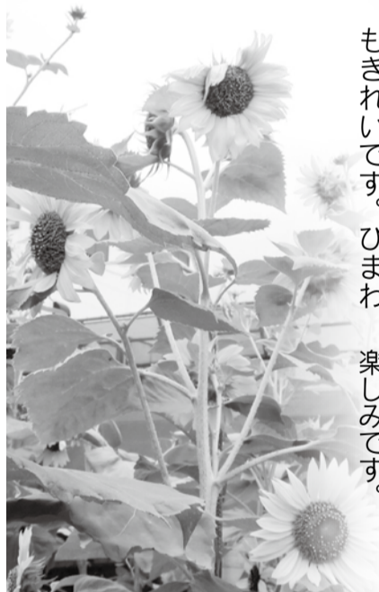
空に向かい咲く大きなひまわり

向日葵は1本の茎に花を10個ほどつけ、一番伸びているものは3メートルを超えています。校舎の非常階段の3階から見ると、とてもきれいです。ひまわり