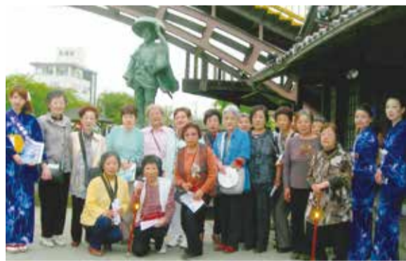
潮来の伊太郎像を前に記念写真

実施しています。このような状況ですが、幸い近隣に八幡神社社務所があり、一同に集まれる場所があるため、3密の回避・換気・マスク着用・体温測定・参加者記録を徹底し活動しております。 今後の活動も会員の方々の意見を聞きながら近隣との新しいコミュニケーションにて交流を深め、地域の輪を上げられればと考えています。超高齢社会の今、古き良きものは残しつつ、新しい風と融合しながら地域すべての高齢者が生きがいを持ち、明るく健康的に良い刺激を与え合える