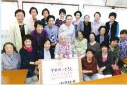
十軒長寿会 会員100歳のお祝い