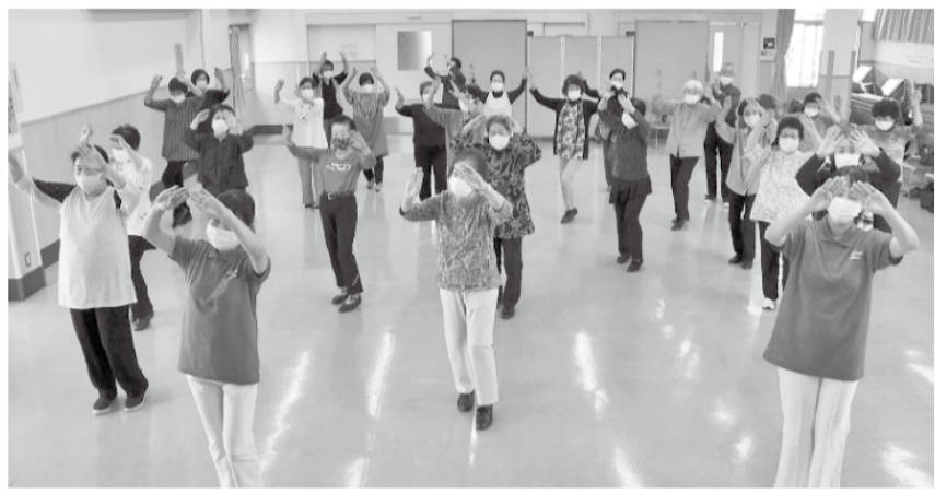
えどちゃん音頭 西篠崎東寿会・鹿二健和クラブ

10月の課題曲を「えどちゃん音頭」と「お湯の富士音頭」とし、区内すべてのリズム運動会場で踊り、楽しんでいる様子を、江戸川区のホームページを通じて映像と写真で紹介しています。