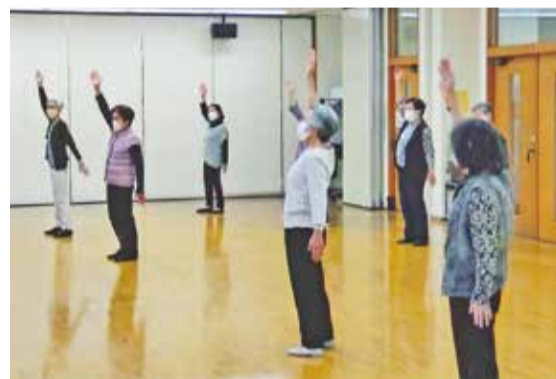
北小岩コミュニティ会館でのリズム運動

さて、五北長寿会へは、神社でのラジオ体操に参加し、古紙回収の担当がいらないからなつてくれと頼まれて回収車に同乗し、リズム運動に参加してかかわってきた。長寿会では、新年会、お茶会、誕生会など2カ月に一回、食事をし、懇談している。集まるとカラオケ、輪投げなどで楽しんでる。また、自治会の清掃、敬老会、交通安全、初午、夏祭り、幼稚園の盆踊りなどにも参加してきた。コロナ禍で、従来の定例の集まりができていないので、食事会に相当する弁当などを配布してきた。会員の反応は良好で、「集まりたい」「会いたい」との声もある。皆さんと会えないのが寂しい。早く会っておしゃべりしたい。