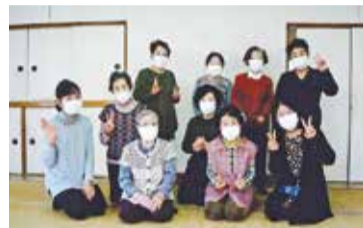
リズム運動参加メンバーでの1枚

リズム運動は、週1回、15名程度で行っています。体を動かせる唯一の場として楽しく集いあつてい