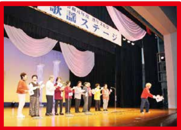
令和元年度 熟年文化祭 (令和2年2月)