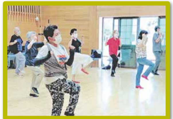
コロナ禍でのリズム運動 (令和3年10月)