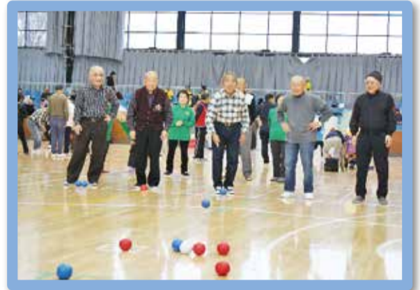
ポッチャ地区交流会 (令和元年9月)