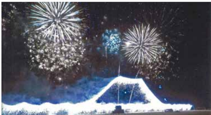
「江戸川区花火大会」 撮影=西小岩中央米寿会・野村和男