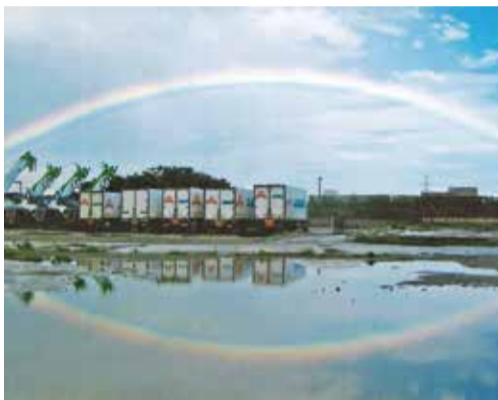
「臨海公園」