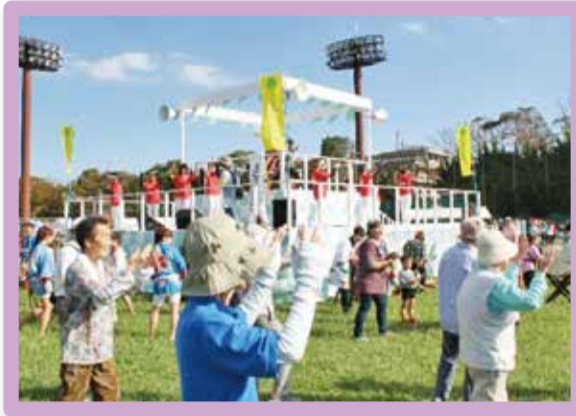
第41回 江戸川区民まつり (平成30年10月)