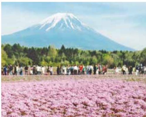
左「富士山と芝桜」 右「江戸川堤上からの夕陽」