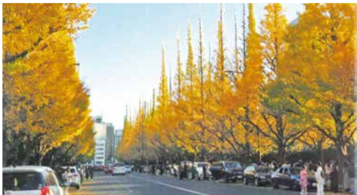
「紅葉・神宮参」