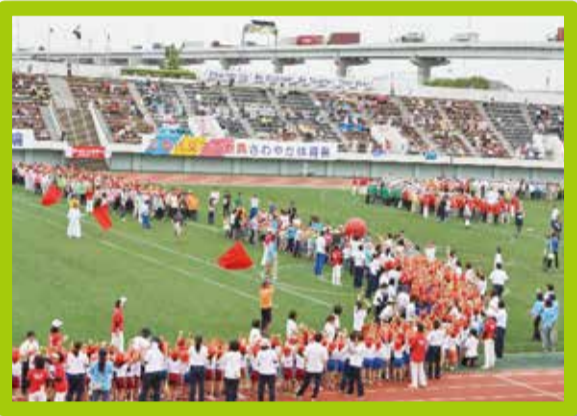
第46回 さわやか体育祭 (平成30年5月)