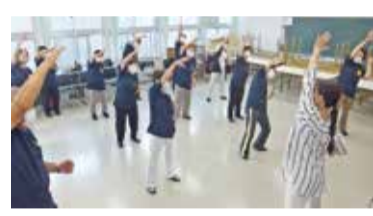
腕をよく伸ばしてストレッチ

篠崎仲町寿会は、昭和47年8月に設立され、今年で50年になります。先輩たちの努力と仲町自治会の協力をいただき今日まで続いてきました。感謝します。