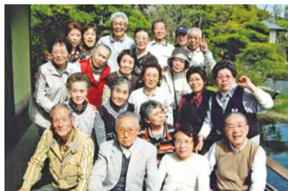
平成庭園源心庵でのお花見

地域活動は、ワンワンウォーキングパトロール大会、春・秋の町内美化運動、夏の納涼大会、宇喜田小島地区区民運動会、7町会合同防