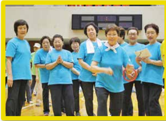
第5回 輪投げ大会 (平成29年7月)