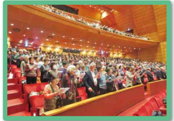
第15回 合唱祭 (平成30年3月)