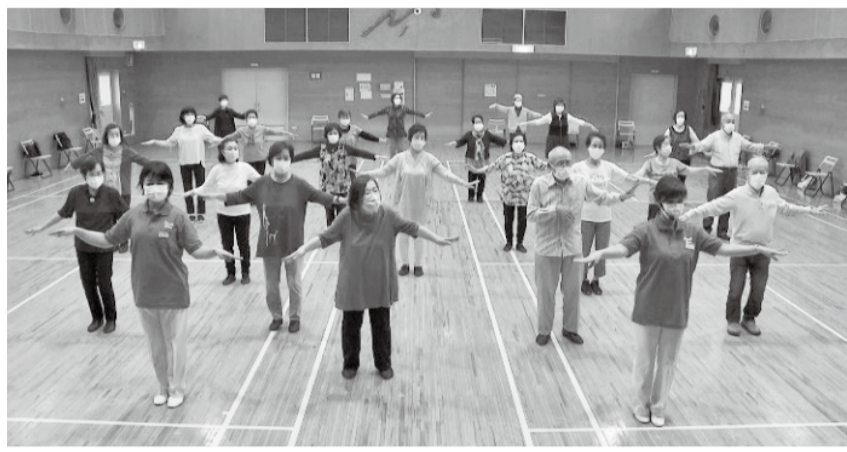
お湯の富士音頭 棒茅場長寿会

会員の方々から、「覚えるのは大変でしたが楽しかったです」「映像で見ることができて良い思い出になった」など嬉しい声がたくさん届きました!!