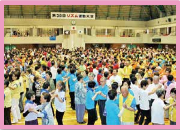
第38回 リズム運動大会 (平成29年6月)

くすのきクラブ連合会が、創立から60年を迎えました。 60周年を記念してこの5年を写真と共に振り返ってみましょう。