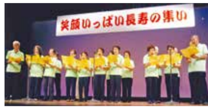
声を合わせて唄います