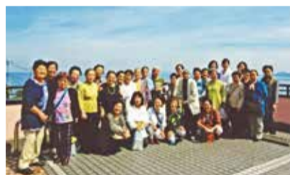
日帰研修 房総半島へ

ます。会員募集時にも、「リズム運動は先生が楽しく教えてくださるから気軽に参加できますよ」と声をかけています。現在は新型コロナウイルスのため、手洗い、消毒の励行、部