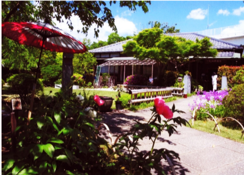
まっこうてい 抹香亭 (一之江五丁目)

江戸時代より抹香作りを行っていた旧家です。庭には樹齢750年以上のタブノキがあり、その葉を乾燥させ石臼で挽き、抹香に加えたと伝えられています。現在は一般公開され、季節に合わせてイベントや展示が行われています。