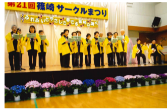
サークルまつりにてみんなで合唱

クラブ誕生から半世紀が経ち、当初とメンバーも大きく変わりましたが、「会員みんなで活動する」という姿勢は変わらず受け継がれています。これからも会員同士協力し合い、よりよい雰囲気クラブを作っていきたいと思えます。