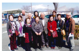
日光への日帰り研修にて