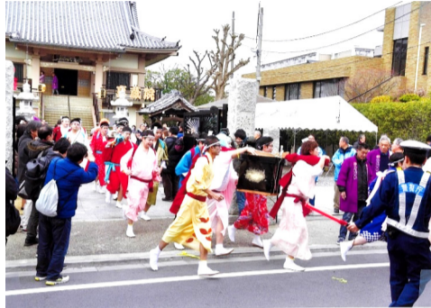
いかづち だいはんにゃ 雷の大般若 (東葛西四丁目)

毎年2月末に行われる、東葛西四丁目の真蔵院に江戸時代末期から伝わる行事です。女装をした男性たちが、大般若経の入った経箱を担いで家々を駆け巡り、無病息災を祈ります。