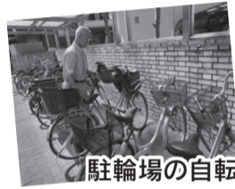
駐輪場の自転車整理