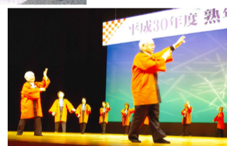
熟年文化祭で楽しく踊り

全員が円になって曲に合わせて踊り、その次にコーラスをしていましたが、どちらもとても上手だと感じました。私たちのクラブも長命会を見習っていきなさいと思います。