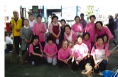
町会の美化運動に参加

今後もこのような活動を継続し、会員同士の交流を活性化に努めていきたいと思います。