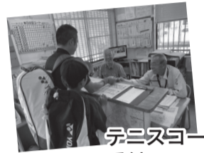
テニスコートの受付