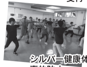
シルバー健康体操で 事故防止