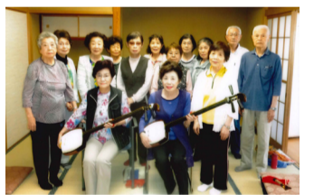
クラブの民謡・舞謡にて

ており発声もしっかりして、何よりも全員が楽しみながら歌っているという感じでした。