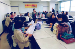
クラブ創立50周年をお祝い

私たちは主に小松川区民館の集会所を活動場所として利用しています。毎週木曜日には近隣の「末広会」「第一末広会」「南親友の会」の合同でリズム運動を行っており、50名前後の方が参加しています。カラオケは月に2回実施しており、プロの作詞家の先生が指導の下で新作の曲を練習しています。その他にも誕生会や1泊2日の研修旅行など、