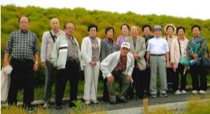
茨城への宿泊研修にて

クラブ誕生から半世紀が経ち、当初とメンバーも大きく変わりましたが、「会員みんなで活動する」という姿勢は変わらず受け継がれています。これからも会員同士協力し合い、よりよい雰囲気クラブを作っていきたいと思えます。