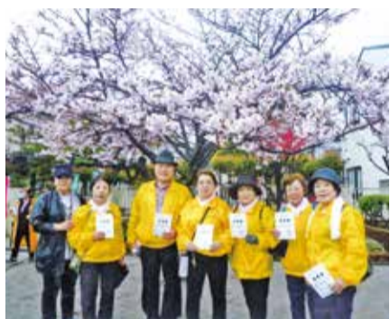
新川千本桜ウォーキング大会

活動としては、毎週木曜日にリズム運動、毎月3回カラオケと輪投げを行っています。輪投げは体を動かすだけでなく、得点を計算することで頭のトレーニングにもなっています。年に2回あるクラブの輪投げ大会では景品が用意され大変盛り上がりします。その