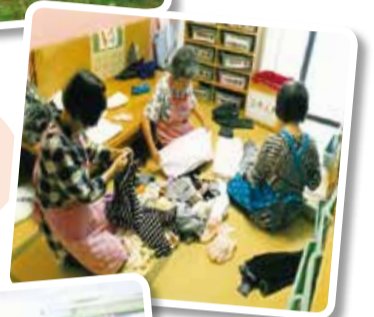
施設での洗濯物たたみボランティア