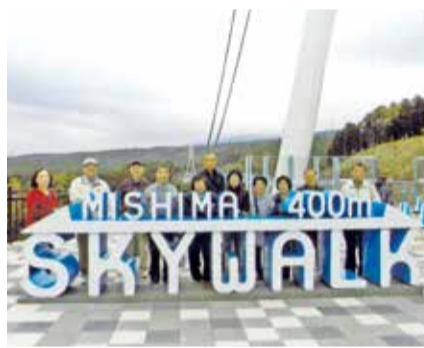
西伊豆へ一泊研修旅行 (三島スカイウォークにて)

ており、清掃活動や町会主催の春・秋の美化運動、盆踊り、もちつき大会にも参加しています。また、町会内にある介護施設にも協力をいただいで町会と合同で「認知症の予防」等の講演会を開催したり、動