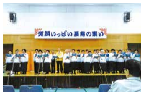
笑顔いっぱい長寿の集い

今後も会員に楽しんでもらえる企画と参加者を増やす努力を続けていきたいと考えています。