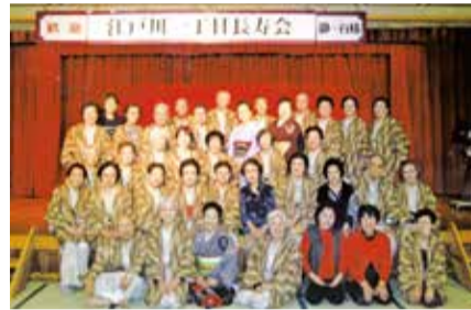
秋保温泉での宿泊研修にて

しており、毎回60人前後の会員が参加しています。輪投げは週に2回行っており、いずれも体の負担にならず会話を含めて体にいいと皆さん