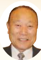
高瀬会長 総会挨拶

ら今日までに、35名の会長が退任され、そのうち4名の方がお亡くなりになりました。そして、昨年度の定期通常総会より本日までに32名の方々が新会長として就任し、そのうち24名の方々が本日より皆様のお仲間入りをいたします。どうぞよろしくお願いいたします。 さて、これまで10月に開催していたさわやか体育祭ですが、今年は5月実施のスポーツチャレンジデーと同時開催となりました。今年の体育祭はこれまで以上に盛り上がりつつあります。このようなイベントをとおして、くすのきクラブをより多くの方に知ってもらうとともに、是非とも近隣の皆様お一人おひとりに声をかけていただき、会員の増強に努めていただきたいと思います。