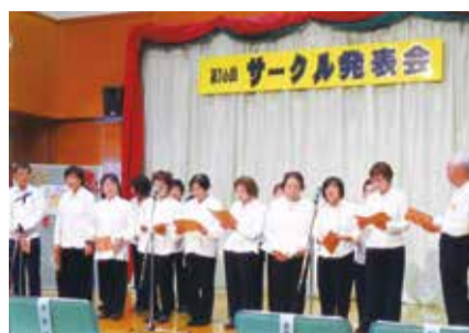
サークル発表会 (南小岩コミュニティ会館にて)

私たちのクラブは南小岩コミュニティ会館を拠点に活動しています。リズム運動は毎週土曜日に行っていて、毎回