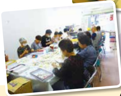
切手整理のボランティア