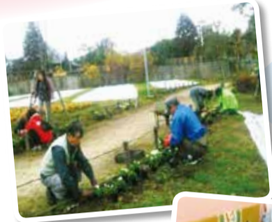
公園の清掃ボランティア