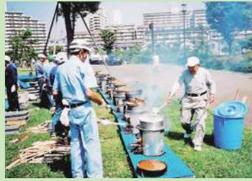
小松川つばさ福寿会 炊き出し訓練に参加