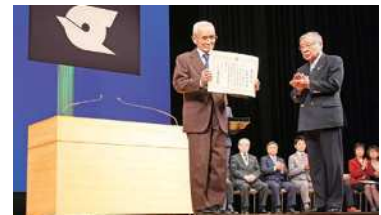
区長表彰を受ける上野連合会副会長