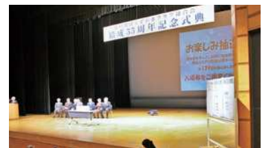
お楽しみ抽選会。1等は九州地方の名産品!