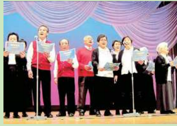
葛西仲町第三永寿会 素敵なコーラス♪