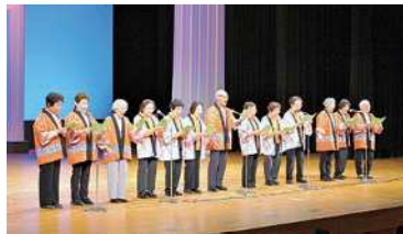
演芸大会は平井東長寿会の息の合った合唱で開幕!