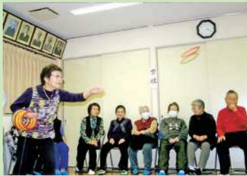
扇子田長寿会 輪投げ練習。入れ！