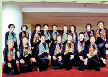
瑞江長寿会 延年文化祭で記念写真