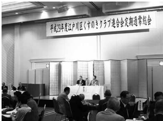
定期通常総会の様子