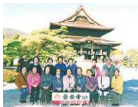
長野県善光寺へお詣り

地域のお祭りや親水公園でのイベントにも参加し、地域との交流も図っています。お祭りでは踊りを通してお祭りの盛り上げにも一役買っています。長寿の集いにも参加しており、この日の