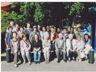
伊豆温泉へお出かけ

が、お寺に温泉にと、とても楽しめました。また、年に1回講演会も実施しています。28年度は防災に関する講演を開催し、区内の約7割が海抜