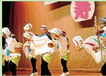
上篠崎喜良久会 長寿の集いで発表