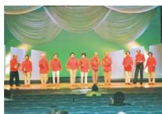
三百六十五歩のマーチを合唱

暮らした方のお宅を訪問してお声掛けするなど、イベントにだけ参加してもらえないよう努力しています。会員さんからは、クラブで集まる回数をもっと増やしてほしいという声も挙がっており、さらにクラブの活動を盛り上げていくために、会員さんの声を広く聴きながら活動の幅を広げていきたいです。