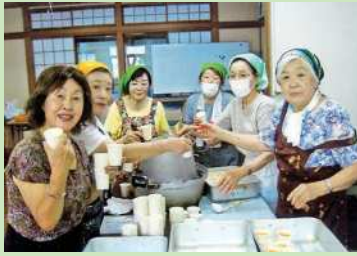
五南長寿会 お祭りボランティア

3月に発行されたくすのきクラブ連合会55周年記念誌を編集するに当たり、皆様から数多くの写真をご提供いただきありがとうございました。掲載しきれなかった写真を一部ご紹介します！