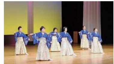
松寿会の見事な舞「菊の宴」