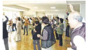
リズム運動準備体操の様子

主な活動は誕生会を年に4回、リズム運動を毎週木曜日、歩こう会を毎週土曜日、輪投げの練習を毎月2回行っています。