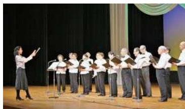
清新北ハイツ若葉クラブの本格的な合唱