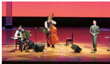
東京大衆歌謡楽団の演奏。3兄弟のハーモニーが響く

が湧き起こりました。また、地域発展のためにご尽力をいただいたと多田区長より温かい言葉をいただきました。演芸大会では各地区から選出されたクラブが華麗な舞や素晴らしい合唱を披露し、最後のお楽しみ抽選会まで会場は大変な盛り上がりを見せました。 くすのきクラブ連合会のさらなる飛躍・発展を目指すことを誓い一致団結する記念の日となりました。