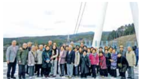
三島スカイウォークにて

に日帰り、秋に宿泊の研修を実施しています。最近では、2015年12月にオープンした、静岡県の三島スカイウォークに行きました。会員は新しい物好きで、すぐ行くこ