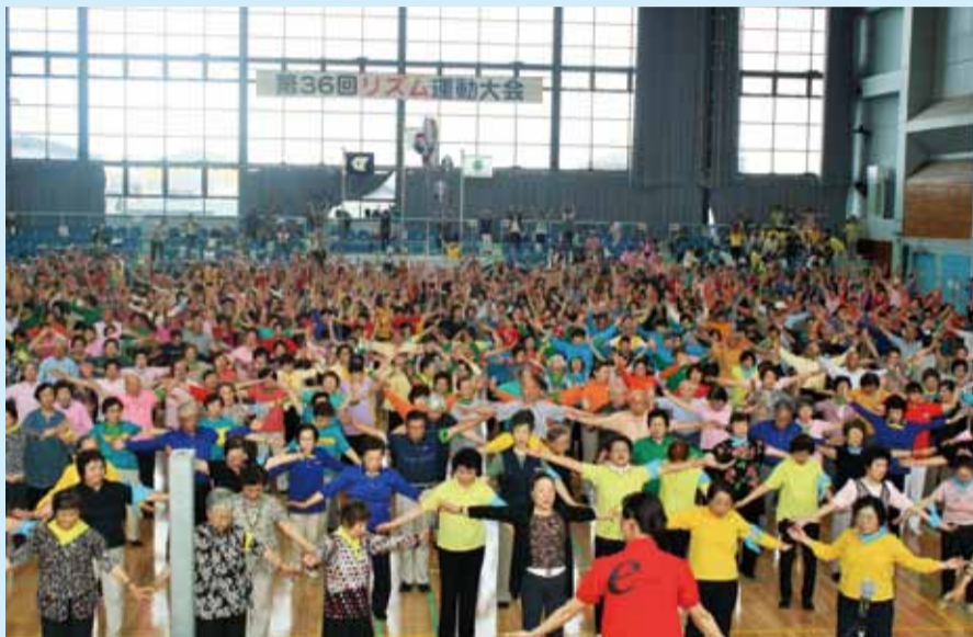
リズム運動大会 (総合体育館)

新年度が始まり2か月が経過しました。近頃は蒸し暑い気候になってまいりましたが、今月のリズム運動大会を皮切りに、くすのきの行事は今年も目白押しです! 外へ出かけることは、健康の保持だけでなく、脳の老化防止にも大きな効果があります。外出頻度が低くなると歩行障害や認知症のリスクも高まるそうです。 暑さや雨で外出が億劫になりがちですが、バランスのとれた食事や適度な水分補給を忘れず、体調に気を付けて積極的に皆で出かけましょう!