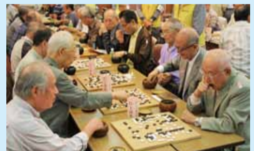
熟年者囲碁・将棋大会