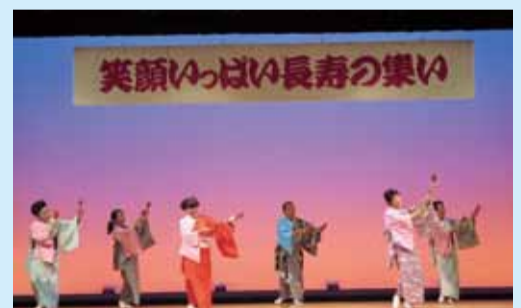
笑顔いっぱい長寿の集い