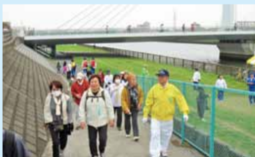
ウォーキングフェスタ