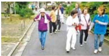
ウォーキングの様子

らも太極拳をやつていること、体の調子がいい！と言われることも多く、最近では女性の参加者も増えてきました。また、ウォーキングも日曜日の朝に行つており、お話をしながら楽しく歩いていきます。その時に、特に意識していることは、笑うこと。笑うこと