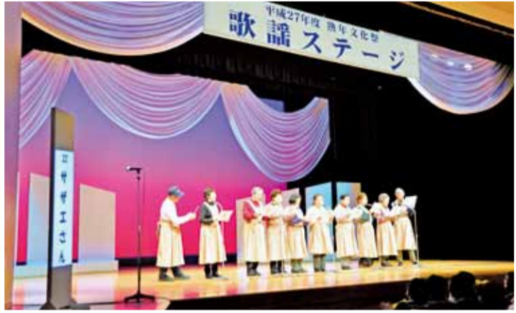
歌謡ステージの様子 (くすのき昭生会)

2月10日(水)、11日(木)に総合文化センターで熟年文化祭が盛大に開催されました。今年も見事な作品が所狭しと飾られ、ホールでは華麗な舞や息の揃った合唱が会場を盛り上げていました。また来年も皆様の参加を心からお待ちしております。