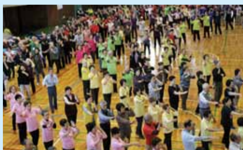
リズム運動地区交流会