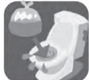
トイレや排水溝をふさぐと逆流防止効果も