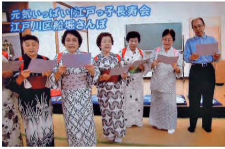
テレビで紹介されました！