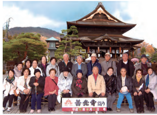
研修旅行 長野・善光寺にて