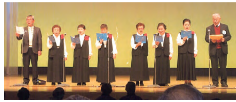
熟年文化祭の様子

大杉第一菊の会は昭和52年に創設されました。また、地域の名産でもある菊の名をクラブに設けました。活動としてはリズム運動やカラオケを主にやっています。