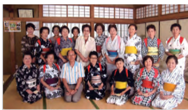
みんなで記念撮影

ります。ただ、会員も協力してくれていますので、とても助かります。いつも頼りにしています。