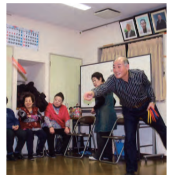
輪投げを楽しんでいます！

すが、勝負には熱が入ります。カラオケ教室も2チーム編成で、合唱祭の練習も兼ねて週1回競い合っています。新年会や年3回ある誕生会では、40人程が参加し歌に踊りに大変な盛り上がりになります。常に和気あいあいとして笑顔が絶えません。他には、町内でのアルミ缶