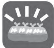
いくつか作って隙間を塞いでください