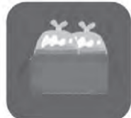
段ボールに入れて使うとより丈夫に