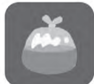
簡易的に土のうの代わりになります