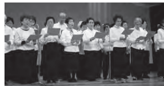
練習の成果を発表