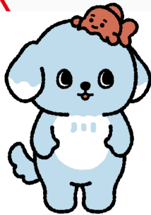
江戸川区PRキャラクター 「エドリバー」