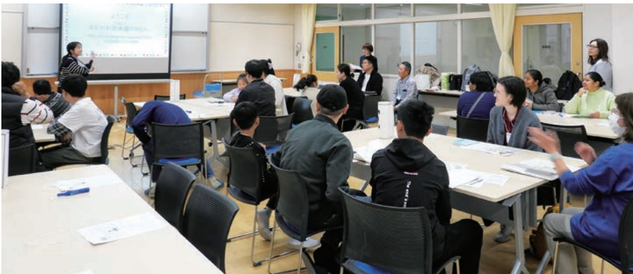
日本語教室「えどがわ日本語クラス」の様子

自宅にいながらにして、区役所に来るのとまったく同じ体験ができるメタバース区役所を実現することは、究極のバリアフリーを実現することだと考えています。