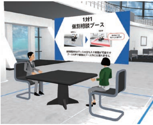
インターネット上の仮想空間にある「メタバース区役所」