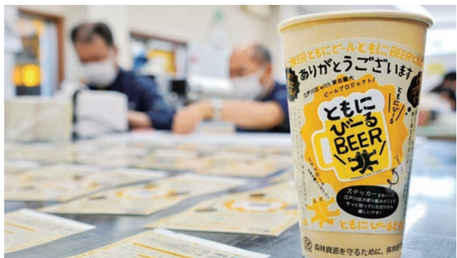
障害のある方などに就労機会を提供する「Edogawa Beer Project」で、オリジナルカップを制作する様子

など柔軟な勤務形態を導入し、図書館という落ち着いた環境の中で本の書架への配置作業などを通じ、就労経験を積んでいただけるようにします。