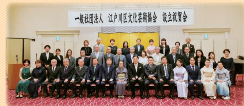
5月17日に設立式と祝賀会が行われました