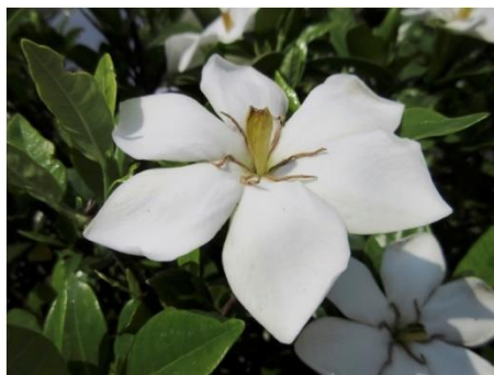
アカネ科クチナシ

【快適睡眠に役立つ漢方薬に用いられる薬用植物の花（千葉大学柏の葉キャンパス薬草園）】