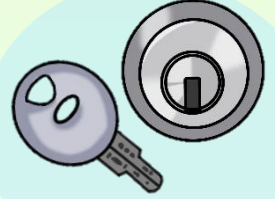
防犯性能の高い錠