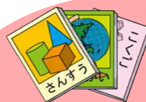
教材・ノートなど