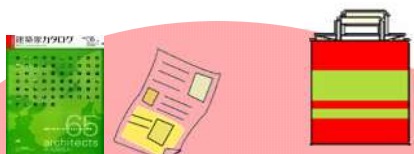
カタログ・チラシ