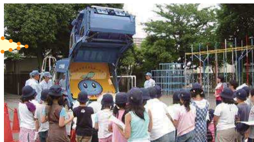
くるま しょくいん てんじょう つく この車は、職員が展示用に作ったものです。

がっこう じゅぎょう なか べんきょう 学校の授業の中で、ごみやリサイクルのことを勉強したり、 おまつりなどでごみの収集体験などをしたりする「環境教 育」を行っています。