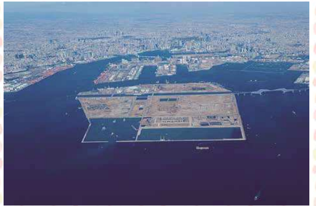
新海面処分場の様子

今使われている新海面処分場は、あと50年くら いは埋め立てできるようですが、東京港に作るこ ができる最後の埋立処分場であるため、少しでも長 く使う必要があります。