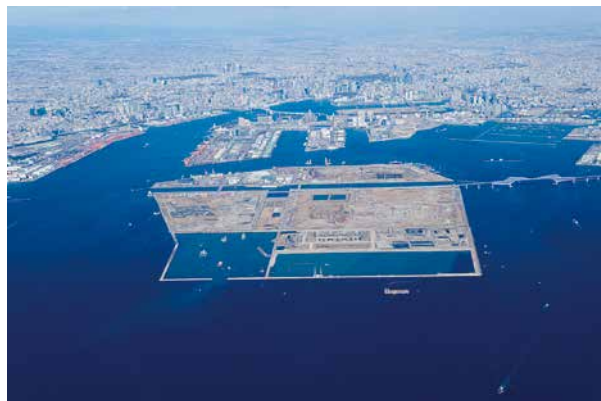
新海面処分場の様子

今使われている新海面処分場は、あと50年くらい は埋め立てできるようですが、東京港に作る事が できる最後の埋立処分場であるため、少しでも長く 使う必要があります。