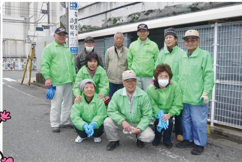
町会のために頑張っている皆さん