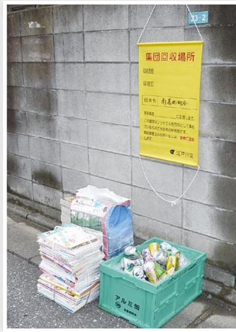
町会が独自に作った集団回収用のコンテナ

集団回収に取り組むようになったのは、わずか3年前ですが、南葛西町会にとって集団回収は大切な町会活動の一つになっています。