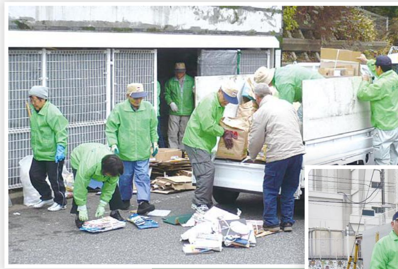
回収した資源を1ヶ所に集めます