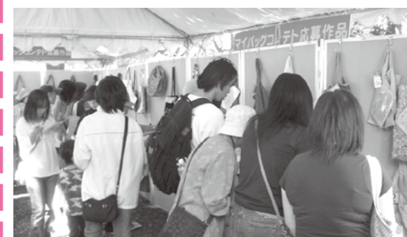
(昨年のマイバッグコンテストの様子)