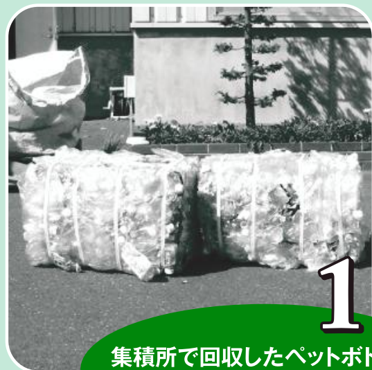
1 集積所で回収したペットボトルを運びやすいようにつぶして輸送