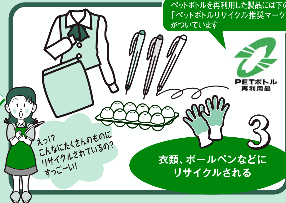
3 衣類、ボールペンなどにリサイクルされる