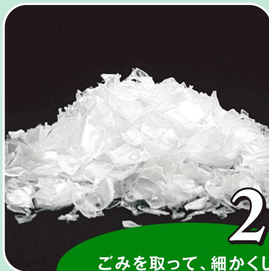
2 ごみを取って、細かくし、リサイクル商品の原料に加工