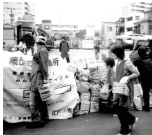
地域のみなさんが協力してリサイクル(南篠崎たけのこ子ども会)

集団回収とは、町会・自治会・子ども会・くすのきクラブ・PTAなどの地域住民団体が家庭から出る新聞・雑誌・段ボール・アルミ缶などの資源を自主的に回収し、契約業者に引き渡す方法です。