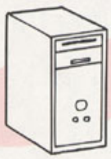
デスクトップパソコン本体