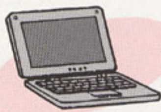
ノートブックパソコン

外側からはプラスチックや鉄が、内部の基盤からは金や銀などの希少金属が、ブラウン管からはガラスなどがそれぞれリサイクルされます。