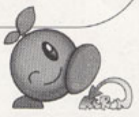
江戸川区リサイクルキャラクター「くるん」

外側からはプラスチックや鉄が、内部の基盤からは金や銀などの希少金属が、ブラウン管からはガラスなどがそれぞれリサイクルされます。