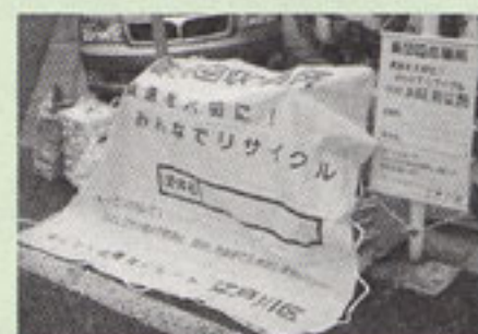
雨よけ・盗難防止シートと回収場所標示旗