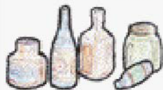
飲食用ガラスびん

つぎのものは、集積所の資源回収で回収します。可燃ごみ、不燃ごみには出さないでください。