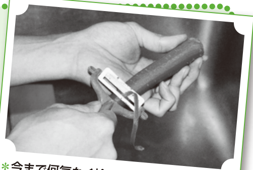
*今まで何気なく捨てていたものを使って* 例えば、野菜の皮や芯、だし昆布など...