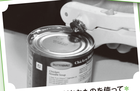
*自宅で余りがちなものを使って* 例えば、買いすぎた缶詰、余った乾物など...