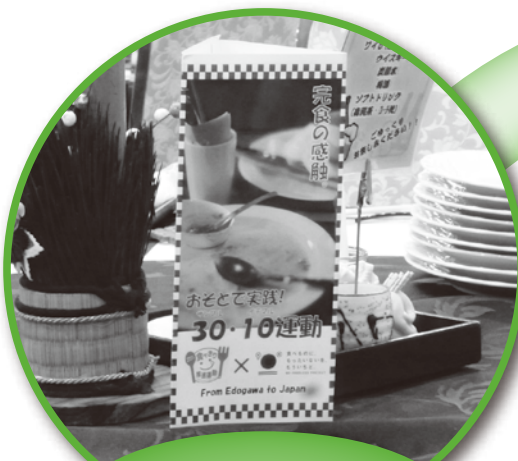
おそとで実践! 30・10運動