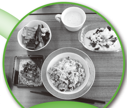
おうちで実践! 30・10運動