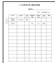
フッ化物洗口剤 薬剤出納簿