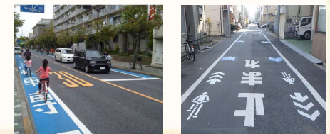
自転車走行環境の整備例

自転車走行環境の整備 ⇒快適で安全な自転車の通行と歩行者の安全を図るため、ブルーレーンによる自転車専用通行帯などを設置しています。一方で道路の幅員によってはブルーの矢羽根や自転車ナビマークを設置し、自転車が通行すべき位置方向を明示しています。