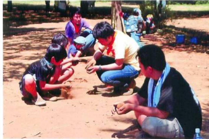
♪泥遊びといったら泥だんごですね

プレーパークの歴史は、第二次世界大戦ごろのデンマークから始まり、その後欧米にも広まりました。日本には1970年代半ばに紹介されました。