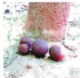
♪みんなが作った泥だんご

武蔵野市で活動しているNPO法人「プレーパークむさしの」の視察に行く予定です。実際に子どもたちが遊んでいる姿、設立されるまでの流れや、運営などの体制についてお話を聞いてきます。