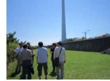
♪旧江戸川右岸活動現場