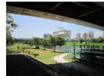
♪大島小松川公園・旧中川