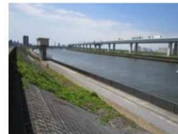
♪中川左岸活動現場