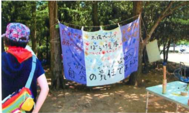
♪木場プレーパークぼうけん隊の旗

今回は、江東区にある都立木場公園へ「冒険遊び場（プレーパーク）活動」の視察に行きました。