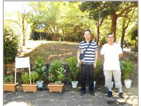
↑緑道利用者との交流の報告