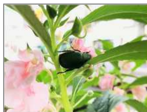
区役所第三庁舎のハウセンカの様子