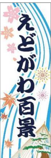
えどがわ百景のロゴマーク

区では、江戸川らしさを象徴する景観ポイントを公募し、「えどがわ百景」を選定しました。そしてパンフレットや探訪マップの配布、カレンダーの販売、写真展の開催などにより、えどがわ百景を通じて区の魅力を発信しています。