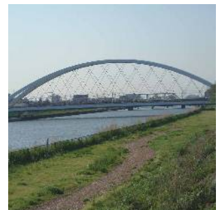
新中川の辰巳新橋 (南小岩六丁目)