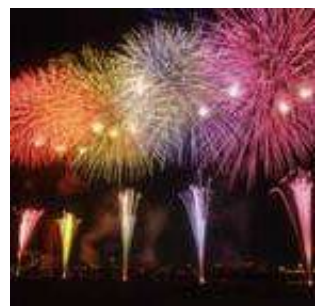
江戸川花火大会 (上篠崎一丁目付近)