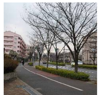
小松川大規模団地のまちなみ (小松川二丁目)