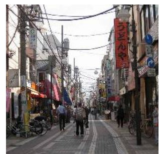
昭和通り商店街 (南小岩七・八丁目)