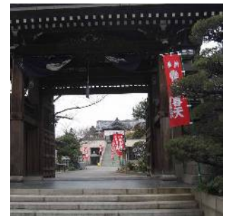
平井聖天燈明寺 (平井六丁目)

区内でも早い時期から都市化が進んだ地域で、平井駅周辺の商店街を中心に発展したまちなみが形成されています。また、平井聖天や平井の渡し、平井一丁目付近の寺社の集積地など、歴史を感じる資源が点在しています。