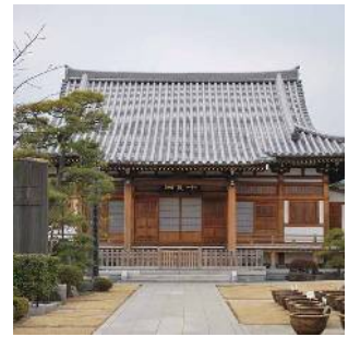
最勝寺(目黄神社) (平井一丁目)