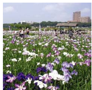
小岩菖蒲園 (北小岩四丁目付近)