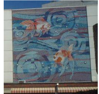
金魚のモチーフのある船堀駅 (船堀三丁目)

都営地下鉄新宿線の船堀駅周辺に商業施設などの中高層の建物が建ち並ぶまちなみと、一之江境川親水公園、古川親水公園を中心に、緑豊かな落ち着きあるまちなみが形成されています。