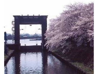
江戸川水閘門(東篠崎町)