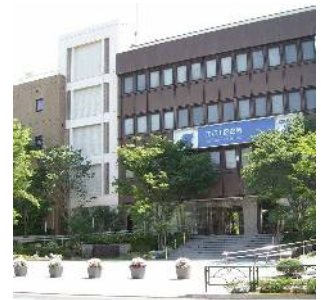
江戸川区役所 (中央一丁目)

区役所や図書館などの公共施設が集積し、その周辺は、区の主要な工業集積地となっています。近年では集合住宅への転換が多く、住工が混在する特色あるまちなみが形成されています。