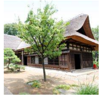
一之江名主屋敷 (春江二丁目)

新しいまちなみの中に、瑞江駅を中心としたにぎわいと、安永年間に再建された姿を残す一之江名主屋敷や、歴代の歌舞伎役者が眠る大雲寺、江戸川水閘門周辺の桜並木など歴史を感じる資源が多く残っています。