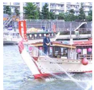
お江戸投網まつり (今井水上ステーション付近)