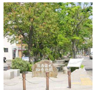
葛西親水四季の道 (西葛西八丁目)