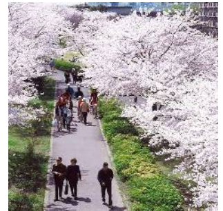
小松川千本桜 (小松川一丁目)

市街地再開発事業により、小松川防災拠点として大規模団地、工業地、大規模公園等が整備され、近代的なまちに生まれ変わりました。また、花の名所となっている小松川千本桜が整備されるなど、水辺に囲まれた緑豊かなまちなみが形成されています。