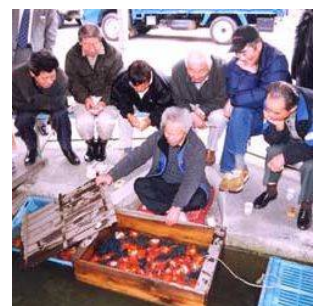
東京都淡水魚養殖漁業協同組合 (船堀七丁目)