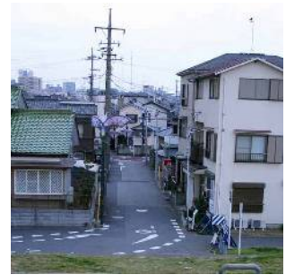
かつての御番所町周辺のまちなみ (北小岩三丁目付近)