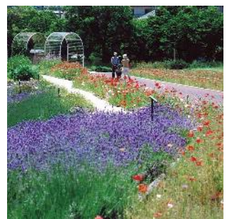
総合レクリエーション公園 なぎさ公園(南葛西七丁目)