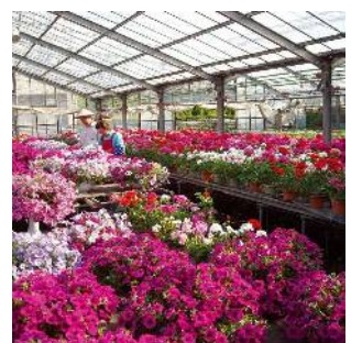
花卉栽培が盛んな鹿骨