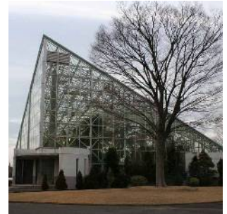
東京都農林総合研究センター 江戸川分場(鹿骨一丁目)

昭和4年に現在の東京都農林総合研究センターが建設され、この周辺は本区の農業振興の拠点となり、今も周辺には花卉や小松菜を栽培する農地が集積するほか、生垣や樹木が植えられている昔ながらの農家住宅が多く分布しています。