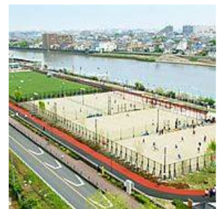
スポーツガーデン (東篠崎二丁目)