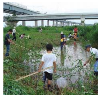
荒川・中川の中堤 (松島一丁目付近)