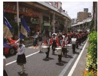
小岩フラワーロード (南小岩六・七丁目)

新中川から柴又街道の間の JR 総武本線以南の地域で、駅南口を中心とした区内一の商店街を形成しています。その周辺は露地園芸や井戸端会議などのコミュニティの景観が形成されています。