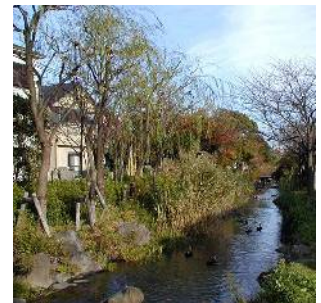
一之江境川親水公園 (一之江六丁目付近)

一之江境川親水公園を中心に、戸建ての住宅地の中に農地が点在する景観が残っています。また、中央部には環七通りがあり、沿道に中高層建物が並ぶまちなみが形成されています。