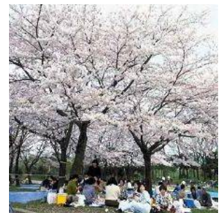
サクラの名所となっている 篠崎公園(上篠崎一丁目)