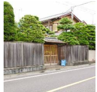
五分一通りの民家 (松島一丁目)