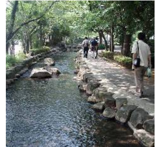
小松川境川親水公園 (松島一丁目付近)

地域の中心に小松川境川親水公園が流れ、その沿線に新小岩駅(葛飾区)から広がる商業のまちなみや、寺社が集積するまちなみが形成されています。