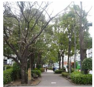
船堀街道・船堀グリーンロード (松江五丁目付近)