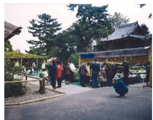
善養寺(東小岩二丁目)

柴又街道から江戸川の間、JR 総武本線以南の地域で、農地が点在する低層の住宅地のまちなみが形成されています。善養寺と影向の松がまちのシンボルとして多くの人に親しまれています。