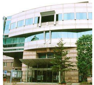
東部フレンドホール (瑞江二丁目)