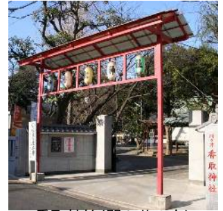
香取神社(間々井の宮) (中央四丁目)