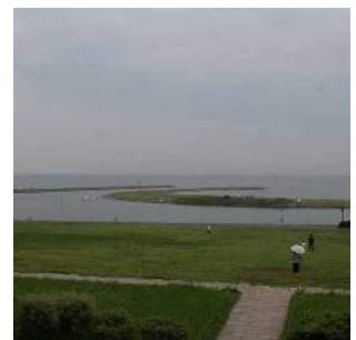
葛西臨海公園・葛西海浜公園 (臨海町六丁目)

葛西沖開発土地区画整理事業の海面埋め立てにより造成された地域で、高層の団地群や流通業務団地、大規模公園が建設され、親水公園や街路樹など豊かな水と緑が計画的に配置されたまちなみが形成されています。