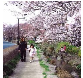
篠田堀親水緑道 (東篠崎一・二丁目付近)