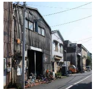
工場が集積するまちなみ (松江四丁目付近)