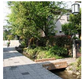
上小岩親水緑道沿いの住宅地 (北小岩六丁目)