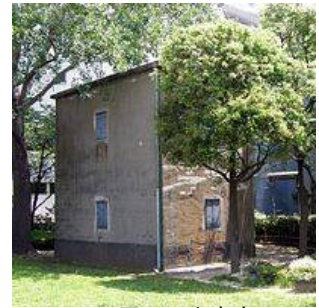
旧江戸川区文書庫 (小松川三丁目)