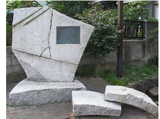
上小岩遺跡発掘調査記念碑 (北小岩六丁目)

柴又街道から江戸川、JR 総武本線以北の地域で、上小岩親水緑道などの親水緑道が整備され、水と緑豊かな良好な住環境がある地域です。遺跡や渡し跡、旧道などの多様な歴史があります。