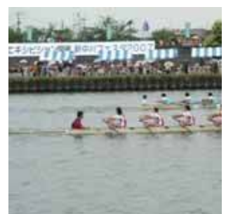
新中川フェスタ (松本二丁目付近)