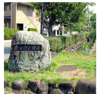
鹿骨親水緑道 (鹿骨三・四丁目)