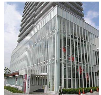
しのぎ文化プラザ (篠崎町七丁目)

広大なスケールを持つ篠崎公園や江戸川河川敷、趣のある浅間神社などが一体となった緑豊かなまちなみと、しのぎ文化プラザ、江戸川総合人生大学や子ども未来館(東部地域)など篠崎駅周辺のにぎわいがあります。