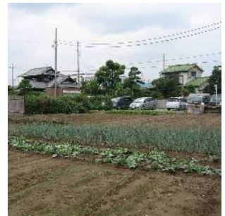
農地が点在するまちなみ (新堀一丁目付近)