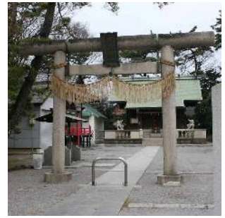
鹿島神社 (鹿骨四丁目)