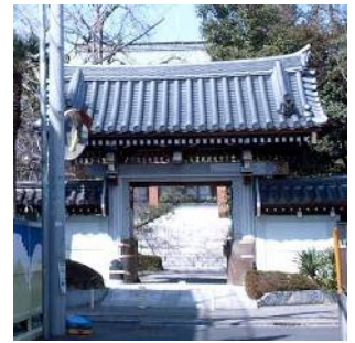
浄興寺 (江戸川三丁目)