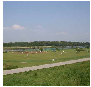
江戸川河川敷 (北小岩七丁目付近)