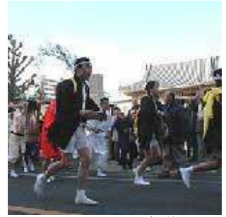
真蔵院(雷の大般若) (東葛西四丁目)