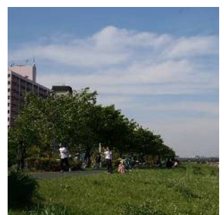
荒川堤防上の健康の道 (小松川一丁目付近)