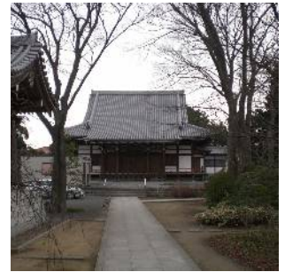
大雲寺 (西瑞江二丁目)