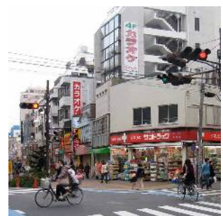
平井駅南口商店街のまちなみ (平井三丁目)