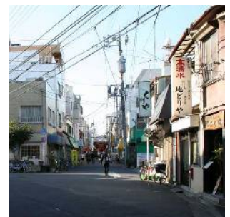
松島の商業が集積する まちなみ(松島三丁目付近)