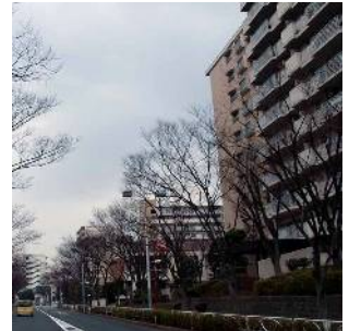
大規模団地のまちなみ (清新町一丁目)