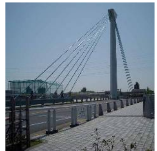
地域のランドマーク大杉橋 (鹿骨一丁目・大杉四丁目)