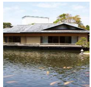
行船公園(北葛西三丁目)

主に江戸時代に新田開発が進んだ地域で、現在は宇喜田公園・行船公園や総合レクリエーション公園を中心に、戸建て住宅と集合住宅が混在するまちなみとなっており、にぎわいの拠点として、西葛西駅と葛西駅があります。