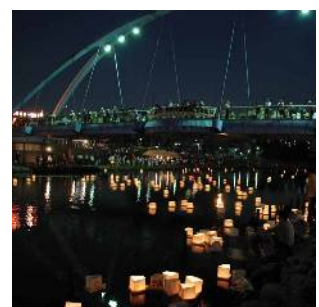
旧中川の灯籠流し (ふれあい橋付近)