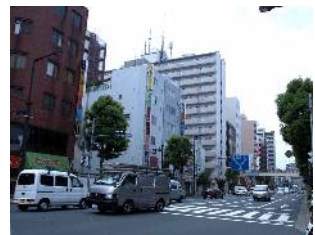
蔵前橋通り(西小岩一・四丁目)

新中川から柴又街道の間の、JR 総武本線以北の葛飾区と隣接する地域で、小岩駅の北口としての拠点と蔵前橋通りの軸をもち、その周辺は住宅地が広がるまちなみが形成されています。