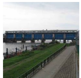
今井水門 (江戸川四丁目)