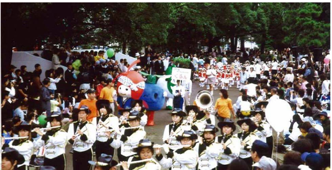
多くのボランティアによって支えられている区民まつり