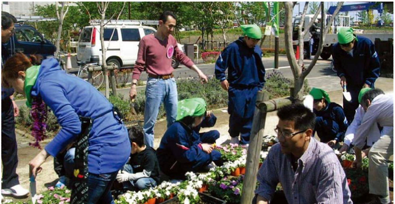
公園ボランティア連絡会主催の緑のフェスティバル