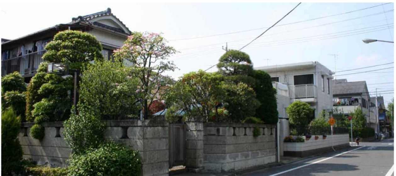
北小岩の住宅地のまちなみ