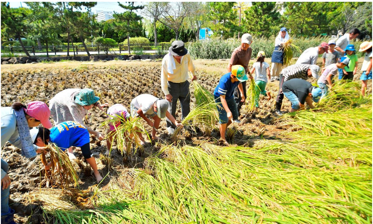
東葛西スポーツ公園の稲刈り体験