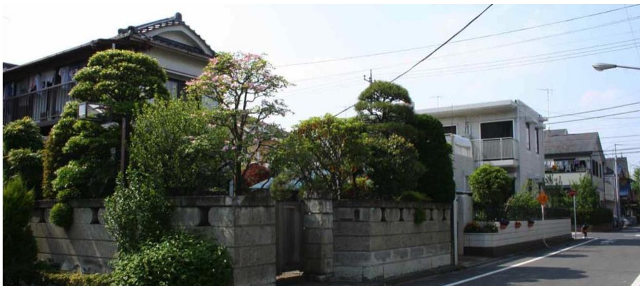
北小岩の住宅地のまちなみ