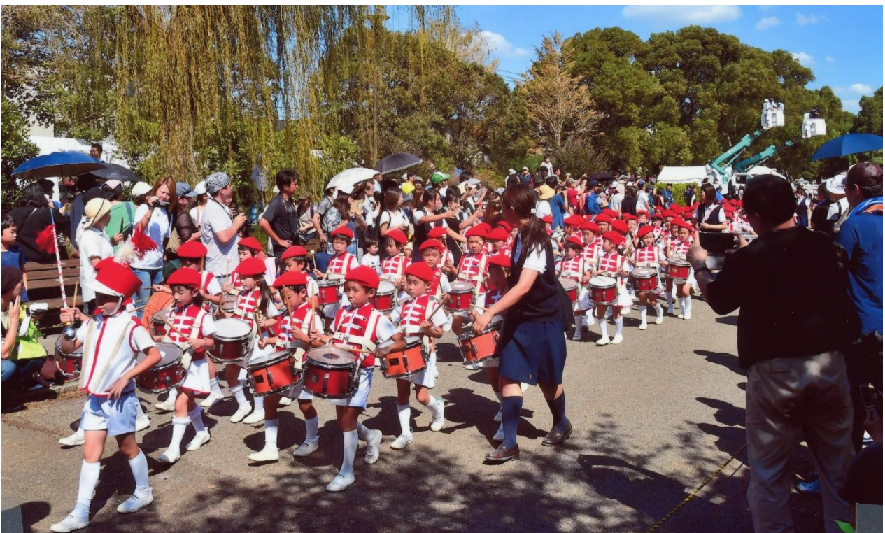
多くのボランティアによって支えられている区民まつり