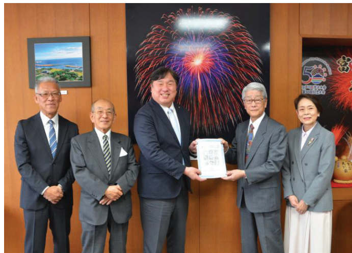
江戸川区長とまちづくり協議会役員の方々