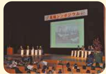
景観シンポジウム開催