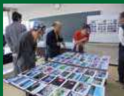
カレンダー写真の選考