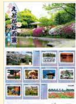
オリジナルフレーム切手