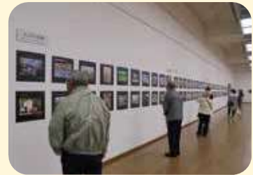
えどがわ百景写真展