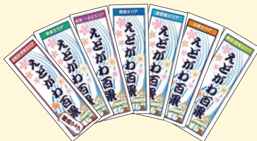
えどがわ百景探訪マップ