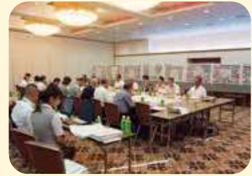
えどがわ百景実行委員会