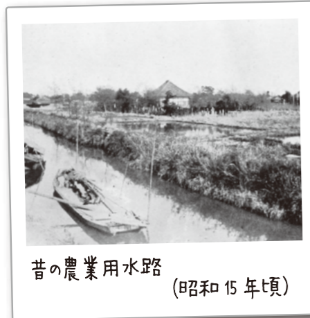
昔の農業用水路 (昭和15年頃)

そのような環境から、自然豊かな水辺を復活させるべく、親水公園の整備を進め、親水公園第1号の古川親水公園に続き、昭和60年に、小松川境川親水公園が完成しました(一部は、昭和57年に完成)。現在、江戸川区には23路線、約27kmに及ぶ親水公園・親水緑道が整備され、地域の貴重な憩いの場となっています。