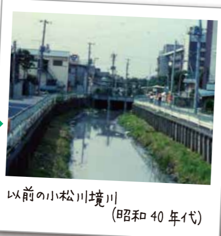
以前の小松川境川 (昭和40年代)