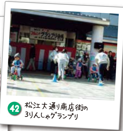
42 松江大通り商店街の 3りんしゅぐらんぷり