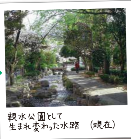
親水公園として 生まれ変わった水路 (現在)