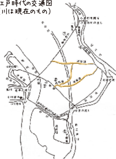
江戸時代の交通図 (川は現在のもの)

今回の中央エリア北コース(裏面参照)は、そんなかつての河原道の道筋が今なお残っている箇所を歩くコースとなっています。ぜひ、タイムスリップした気持ちになって、歩いてみてください。