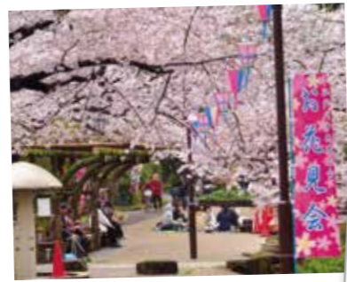
43 桜満開 江戸川中央商店会まつり