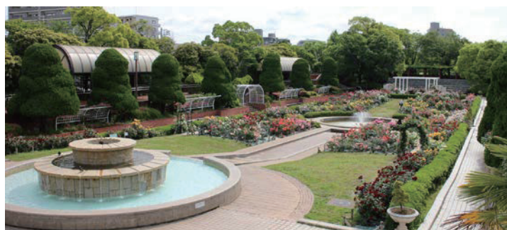
フラワーガーデン