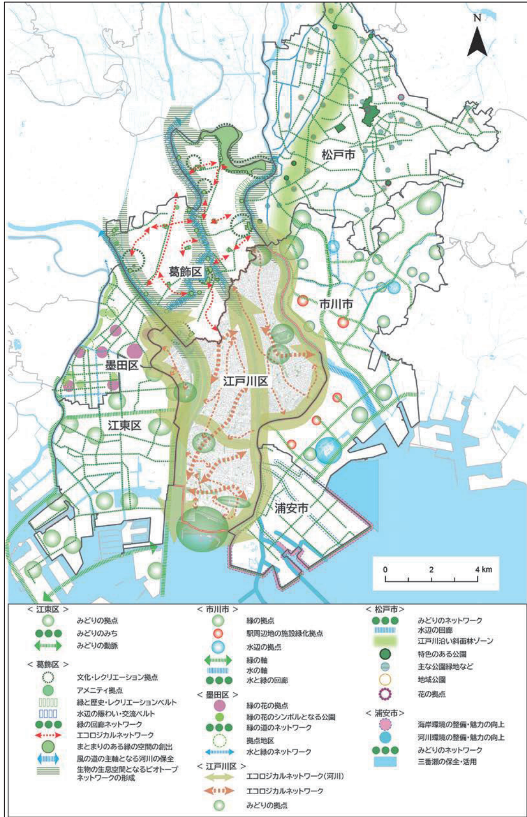
近隣自治体の状況

ここでは、近隣市の緑の基本計画で示されている水とみどりの拠点および軸やエコロジカルネットワーク*を整理します。