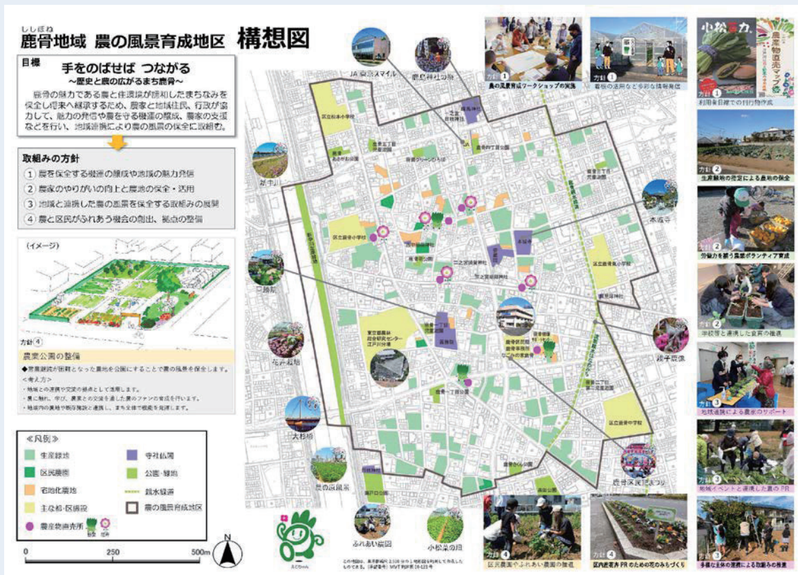
鹿骨地域農の風景育成地区 構想図

今後は、農の風景育成地区に指定された鹿骨地域を中心に、意見交換の結果をまとめた「農の風景育成計画書」に基づき、農の風景を守るためのプログラムを展開していきます。