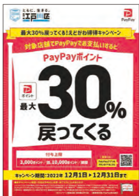
「えどがわお得キャンペーン」は12月末まで実施中

また、電力・ガス・食料品などの価格高騰への対策として、国が9月に発表した住民税非課税世帯などに対する5万円の緊急支援給付金についても、申請を必要としない世帯に対してプッシュ型で通知をお送りし、12月初旬より順次給付を開始してまいります。