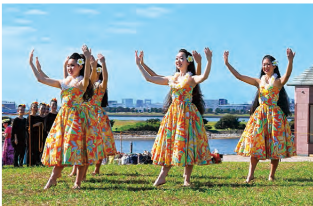
葛西臨海公園で同時に開催した「SDGs FES」(上)と「ホノルルフェスティバル」(下)。延べ約2万人の方が訪れました