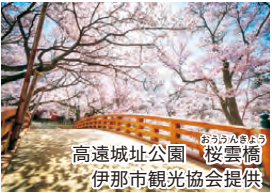
高遠城址公園 桜雲橋