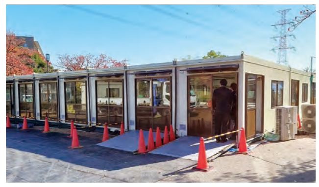
「新田6号公園」(写真)と「旧くつろぎの家」のワクチン接種会場は比較的予約が取りやすくなっています

しかし、今年の冬は昨年や一昨年と異なり、季節性インフルエンザとの同時流行が懸念されています。これまで以上に多くの発熱患者が生じる可能性も視野に入れながら、社会全体で備えを強化していかねばなりません。 そのために、まずもって重要なこととしてワクチンの接種があります。そこで現在、皆さまに安心して年末年始を迎えていただくため、オミクロン株対応ワクチンの早期接種をお願いしているところ