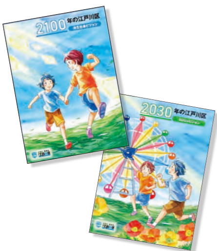
未来に向けた2つのビジョン

しかし現実には、それよりもさらに厳しい未来になる可能性を示唆しています。つい数年前まで6千人以上あった年間の区内の出生数は、令和3年に5千人を下回りました。またそれに伴い、本区の合計特殊出生率も大きく下がる見込みです。新型コロナウイルス感染症の影響があるとしても、現実として推計より早く人口減少は進行しており、このままでは2100年の人口が現在の半分近くに近づいてしまふ可能性もあります。