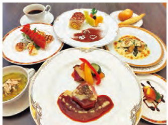
クリスマスディナーコース ※写真はイメージです。

今年のクリスマスは、ホテルで贅沢な時間を過ごしませんか。館内にある「レストランシーサイド」では、12月23日(9時)～25日(9時)まで「クリスマスディナー」コースをご用意しています。シェフ自慢のコース料理をお楽しみください。