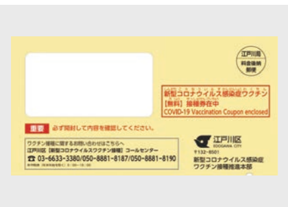
前回、集団接種を受けた方には、あらかじめ会場・日時が記載された接種券をお届けします

二つ目の「ワクチン接種」については、3回目の接種に向けて滞りなく進むよう体制を整えています。先日はまず、医療従事者向けの接種券を発送しました。12月以降順次、接種していただける予定です。(P4へ続く)