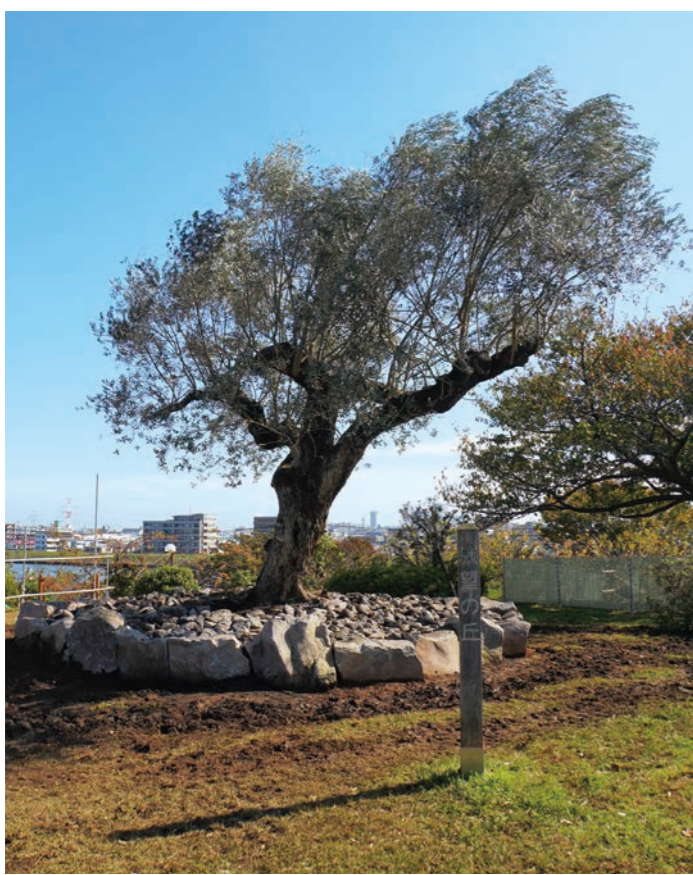
ブイロクの木を見に訪れた方が1600人を超えた日も