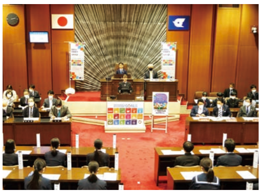
中学生議会ではジェンダー平等や災害対策などの区政課題について質問や提案が行われました

目の前にいる子どもたちが、たくさんの我慢を強いられる中でも工夫を重ねながら、学校代表として式典に参加している凛々しい姿に触れると、この子どもたちが成長した時に「あの時の大人たちも頑張っていたな」と思ってもらえるようにしなければと、今の時代を生きている者としての責任を強く実感したところであり