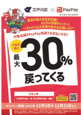
「えどがわお得キャンペーン」は12月末まで

これは、12月の1カ月間、対象店舗においてキャッシュレス決済サービス「Pay Pay」で買い物をすると、購入金額の30%分のポイントが戻ってくるというものです。厳しかった1年の終わりに、ま