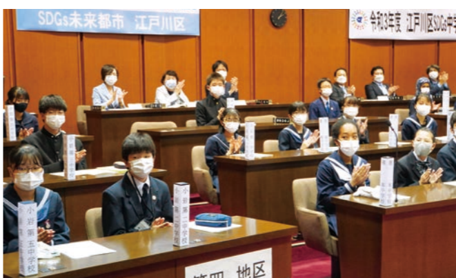
江戸川区 SDGs 中学生議会に参加した各校の代表生徒たち

先日は議員の皆さまの主催により、「江戸川区SDGs中学生議会」がこの議場において開催されました。各中学校を代表して参加した生徒の皆さんより、SDGsの視点から区政課題についてさまざまな質問を頂き、私や幹部職員から答弁をさ