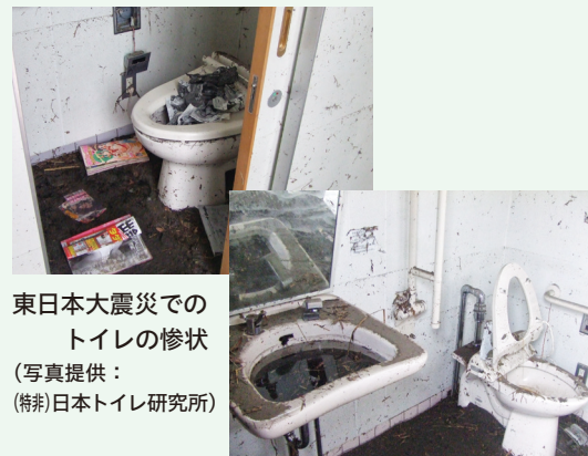
東日本大震災でのトイレの惨状

過去の震災では断水や排水ができない状態で使用し続けたことにより、再使用できないほど便器が汚れてしまった事例があります。健康を守ることもつながりますので、使用する皆さんでトイレをきれいに保ちましょう。