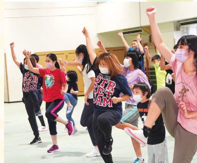
この半年取り組んできたヒップホップの曲が流れるとみんなノリノリです