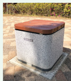
▲普段はベンチ、有事の際にはマンホールトイレとして使用できるスツール型トイレ