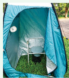
▲目隠し用のテントと便器を設置するだけで使用可能なマンホールトイレ

震災時の備えとして、災害時対応トイレの整備、携帯トイレの備蓄、既設トイレの耐震化に取り組んでいます。災害時対応トイレとして、マンホールに直接排せつ物を流すことができる「マンホールトイレ」の小・中学校や公園などへの整備を進めています。